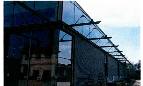
v.l.n.r.: Wohnanlage am Tegernsee/Bayern, Panorama-Aufzug auf der Burg Rabenstein, Team Styria Werkstätten in Graz

■ Vor mehr als 40 Jahren wurde das Unternehmen Lackner Loibnegger + Partner als technisches Büro gegründet. Die Ausgangsbasis war ein Ingenieurbüro für Stahlbau bzw. statisch-konstruktive Bearbeitung von Tragwerken aus Stahl, Beton, Holz, Glas oder Sonderbaustoffen. In den letzten 20 Jahren hat sich herauskristallisiert, dass viele Auftraggeber ein erweitertes Planungsangebot wünschen. Der Planer soll ein Objekt, welches die, vom Auftraggeber gestellten Anforderungen erfüllt und zu einem vorher vereinbarten Budget errichtet wird, entwickeln. Dabei soll die gesamte Planung aller Gewerke und das Projektmanagement sowie die Kostensteuerung aus einer Hand kommen. Teilweise ist vom Bauherrn auch eine schlüsselfertige Errichtung des gesamten Objektes gewünscht. In zahlreichen Projekten konnte Lackner Loibnegger + Partner als Generalplaner oder auch als Totalunternehmer beweisen, dass eine solche Generalplanung unter Einhaltung eines engen Kostenrahmens für den Auftraggeber viele Vorteile bringt.