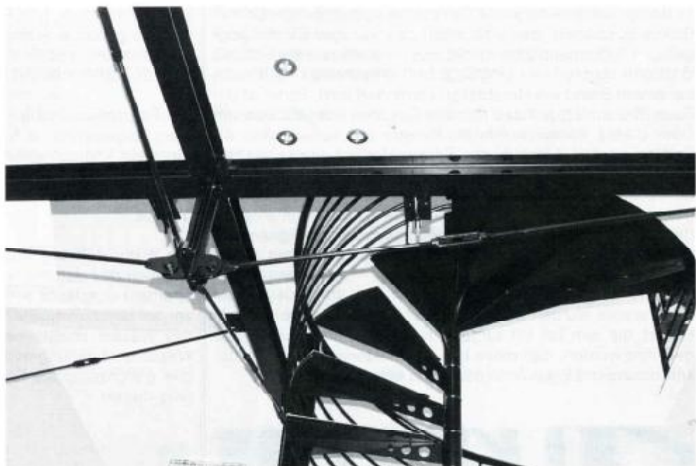
Unterstützungsstruktur für die Zwischendecke

Die Horizontallasten werden über die bestehenden und verstärkten Streben und Zangen der Hauptgespärre abgeleitet. Um im Galeriebereich eine entsprechende Raumhöhe zu erreichen, wurde der hölzerne Brustriegel entfernt. Die Funktion des Brustriegels übernimmt ebenfalls das kreuzförmige unterspannte Trägersystem. Sämtliche neu eingezogenen Zwischendecken lagern auf der Stahlkonstruktion und sind Holztramdecken, welche an der Unterseite mit Gipskarton-Feuerschutzplatten verkleidet wurden. Im Deckenzwischenraum wurde zur besseren Schalldämmung eine Schüttung aus geblühtem Sand eingebracht und darüber ein Holz-Blindbodenaufbau mit Fichtenholzdielen als Oberbelag ausgeführt. Die Verbindungstreppe zur Galerie ist als Stahl-Wendeltreppe ausgeführt. Auf einem Tragrohr sind die einzelnen Stufenelemente aufgefädelt. Zwischen den einzelnen Stufenelementen sind polierte Stahlringe zur Feinjustierung der Geschoß- bzw. Auftrittshöhen angeordnet. Als Gehbelag für die Stufen dient ein strukturiertes Aluminiumblech, welches mit einer Distanz von ca. 20 mm über dem Tragblech montiert ist. Zwischen Tragstufe und Belagblech sind Gummi-Dämpfungselemente zur Verminderung der Körperschallbelastung angeordnet. Sämtliche Stahl-Einbauteile mußten so vorgefertigt werden, daß die Einzelteile an der Baustelle nur noch verschraubt