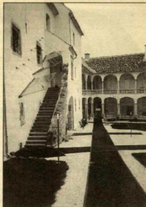
1984 startete die Aktion „Neues Leben in alten Mauern“ – jetzt stimmt der Slogan

8230 HARTBERG, GARTENGASSE 6 TEL. 0 33 32/62 2 50 FAX 0 33 32/62 2 50-21 AUTOTEL. 0 66 3/031616